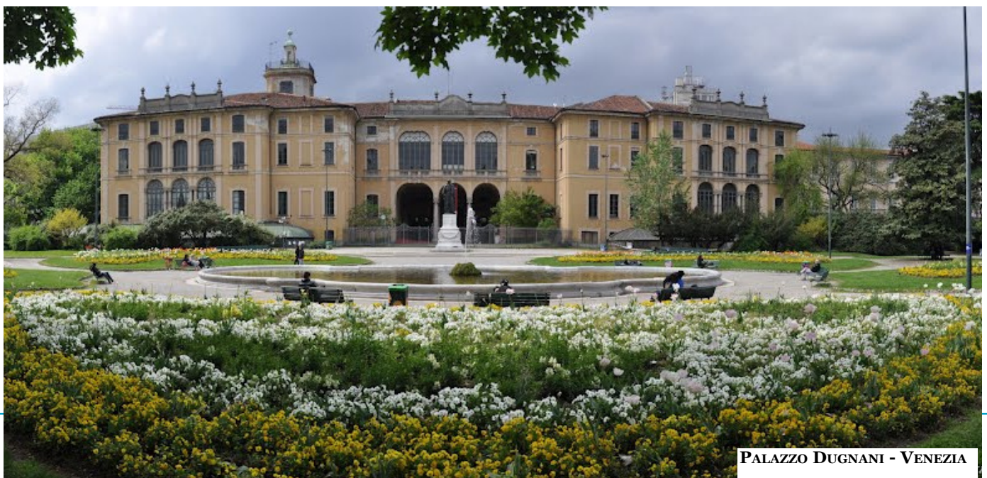
PALAZZO DUGNANI - VENEZIA